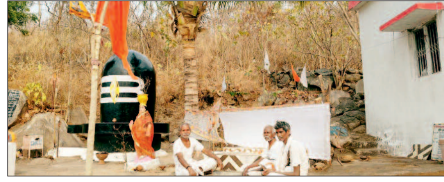
हरिभूमि न्यूज | नगरी

सिहावा अंचल में स्थित अगस्त ऋषि आश्रम की पहाड़ी इन दिनों श्रद्धालुओं के लिए विशेष आस्था का केंद्र बन गई है। वनांचल और प्राकृतिक सुंदरता से भरपूर यह क्षेत्र प्राचीन काल से ही सप्तऋषियों की तपोभूमि के रूप में प्रसिद्ध रहा है। ग्राम हरदीभाड़ा और मुकुंदपुर के बीच स्थित इस पहाड़ी पर एक पवित्र स्थल है, जिसे स्थानीय लोग गंगा मैया का स्थान मानते हैं। चैत्र नवरात्रि के अवसर पर यहां दीप प्रज्वलन और पूजा-अर्चना के साथ भक्तिमय माहौल देखने को मिला। बड़ी संख्या में श्रद्धालु दूर-दूर से यहां दर्शन के लिए पहुंच रहे हैं।