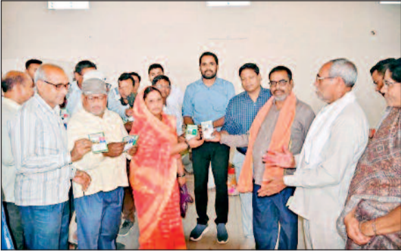
हरिभूमि न्यूज ►►धमतरी